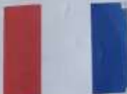
French - Français