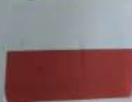
Polish - Polski