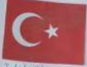
Turkish - Türkçe