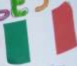
Italian - Italiano