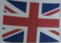
English - English